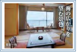
望む景色 海の広がりを

1泊目 海と一体になった「インフィニティ温泉」と新鮮な海の幸が自慢 宮城県 南三陸温泉 指定