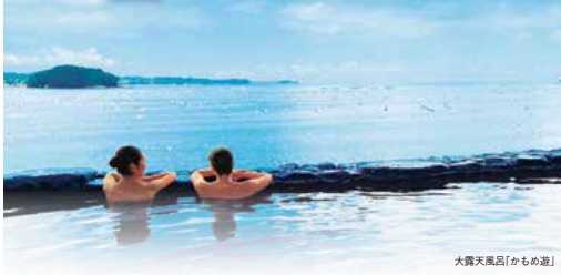
大露天風呂「かもめ湯」

1泊目 海と一体になった「インフィニティ温泉」と新鮮な海の幸が自慢 宮城県 南三陸温泉 指定