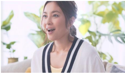
ショッピングチャンネル との