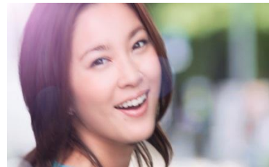
ショッピングチャンネル。