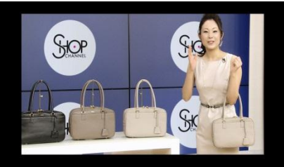
(ショッピングチャンネル 番組シーン)